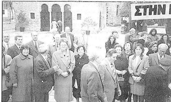
Στον περίβολο της Ι.Μ. Πεντέλης, μετά τη θεία λειτουργία. Δυστυχώς δεν βγάλαμε φωτογραφία που να φαίνονται όλοι οι συμπατριώτες γιατί άρχισε να φιλολοβρέχει.

Ήταν μια κατανυκτική θεία λειτουργία, όπου είχαμε την ευκαιρία να παραστούμε σε χειροτονία νέου ιερέα, στην οποία προέστη ο θεοφιλέστατος επίσκοπος Βρεσθένης κ. Δημήτριος Τρακατέλης, καθηγητής της Θεολογίας