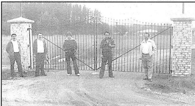
Αραχωβίτες στην είσοδο του Πάρκου Καρυατών στο Toronto (φωτ. 1980).

Αγαπητοί φίλοι. Είλαβα την ανακοίνωση της Αδελφότητας Toronto για τον ετήσιο αποκριτικό χορό σας που θα γίνει στις 8 Μαρτίου στο ORION SEAFOOD, με το πρόγραμμα, που όπως φαίνεται είναι πολύ καλά οργανωμένο αλλά δυστυχώς, ήλθε σε χρόνο που αν τα δημοσίευα στο φύλλο 46 των «ΚΑΡΥΩΝ» θα το διάβαζαν οι αναγνώστες μας κατόπιν εορτής. Πέρσι το είχα δημοσιεύσει και συνέβη το ίδιο.