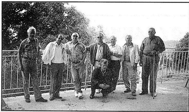
Η πλατεία της Βαρθίτσας, το μπαλκόνι του Πάρνωνα.